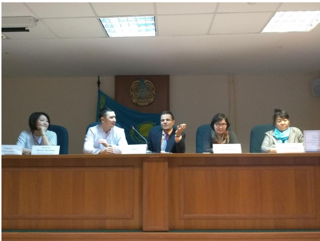
Фото 3. ССК орталық ұжымымен қорытынды кездесу өткізеді

Қорытындылай келе, сарапшылар жұмыстың бірінші күнінің қорытындыларын талқылады, алған әсерлерімен бөлісті, аккредиттеудің бірқатар стандарттарына сәйкестігі бойынша пікір алмасты, ҰҒОО сапарының екінші күнінің іс-шараларын жоспарлады