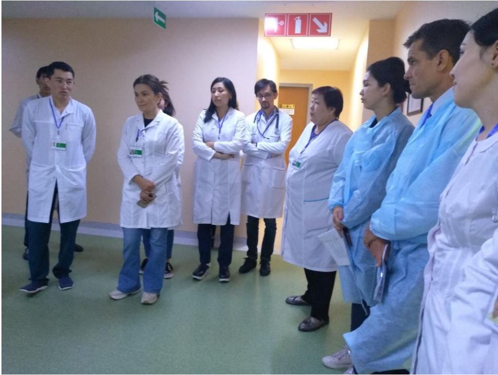
Фото 2. ССК-нің орталық бөлімшелеріне сапары