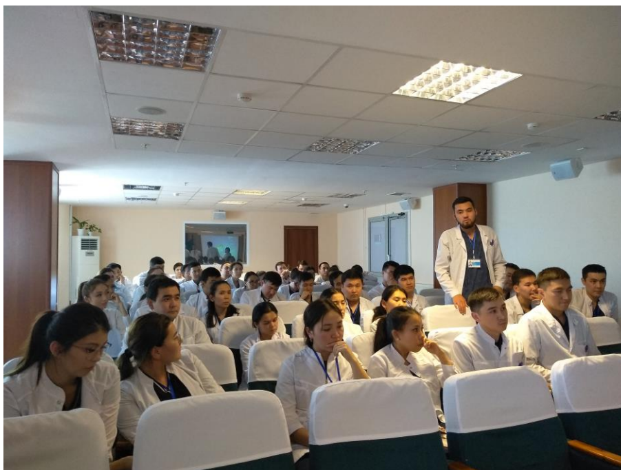
Фото 4. Резиденттермен сұхбат

Әрі қарай сарапшылар БЖТ бойынша құжаттаманы зерделеуге кірісті, оның ішінде БЭК мүшелерінің сұранысы бойынша: резидентура бағдарламалары, ҒДП, ПОЭК бойынша бағдарламалар, бақылау-өлшеу құралдары, резиденттермен және оқытушылармен кері байланыс.